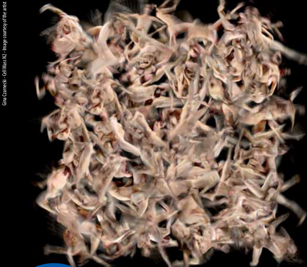
Gina Czarnecki - Cell Mass N2